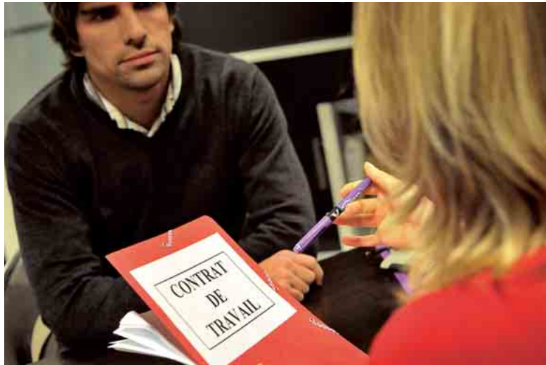
Lors de l'entretien, le candidat doit encore convaincre la DRH d'avoir fait le bon choix.

La RATP prévoit, quant à elle, 230 nouveaux contrats d'alternance pour for-