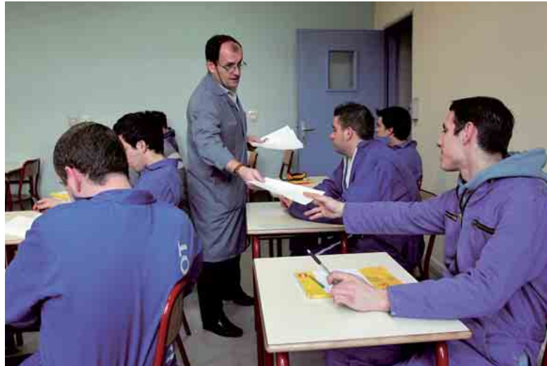
L'alternance entre l'école et l'entreprise implique un rythme difficile à prendre au début.

► Accepter une mission en décalage avec son cursus. L'alternance doit favoriser la mise en pratique de l'enseignement reçu à l'école. Attention aux contrats d'apprentissage ou de professionnalisation sans lien réel avec la