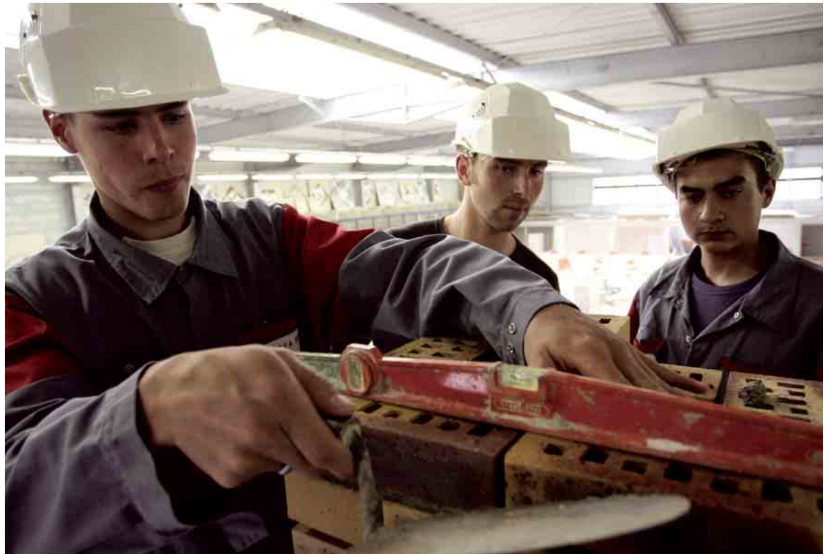
En entreprise, l'apprenti est suivi par un tuteur qui lui fixe des missions à accomplir et évalue son travail régulièrement.

Dans le cadre d'un contrat d'apprentissage, la rémunération varie entre 25 % et 78 % du smic selon l'âge du jeune et l'ancienneté dans l'entreprise. Pour le contrat de professionnalisation, le salaire dépend de l'âge et du niveau de formation. Les moins de 21 ans touchent au minimum 55 % du smic ou 65 % s'ils possèdent un bac professionnel ou équivalent. Entre 21 et 26 ans, leur salaire atteint au moins