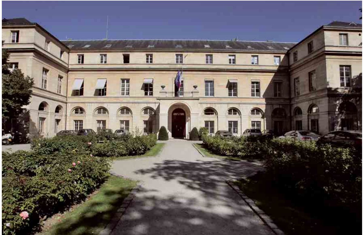
Il est désormais possible aux jeunes d'intégrer le ministère de l'Enseignement supérieur et de la Recherche sans passer de concours.

► Les modalités. Les offres de postes sont déposées sur www.fonction-publique.gouv.fr (rubrique « être fonctionnaire »), dans les missions locales, aux agences Pôle emploi, et sur les sites Internet des ministères. Actuellement, le ministère des Affaires étrangères propose par exemple 7 offres de Pacte, celui de l'Education 89, celui de l'Enseignement supérieur 186, celui de la Défense 28. « Les candidats soumettent leur dossier à Pôle emploi, sans avoir besoin d'y être inscrit auparavant », précise le ministère. Les personnes retenues sont ensuite convoquées à une audition de